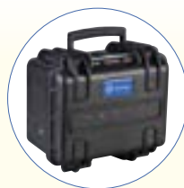
SB 270_EB Externer Akku 33 Ah